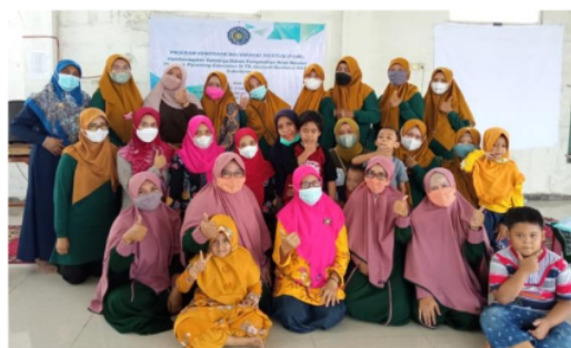
Gambar 3. Tim pengabdian dan wali murid TK Aisyiyah setelah kegiatan parenting education

Berdasarkan gambar diatas dapat diketahui bahwa sebelum mengikuti kegiatan parenting education sebagian besar wali murid (71%) memiliki pengetahuan yang kurang tentang pengasuhan anak, dan setelah mengikuti kegiatan parenting education sebagian besar wali murid (54%) pengetahuan ibu tentang pengasuhan anak menjadi baik. Wali murid mengaku senang dengan kegiatan ini karena dapat menambah wawasan dan ketrampilan mengasuh anak yang penting untuk perkembangan anak.