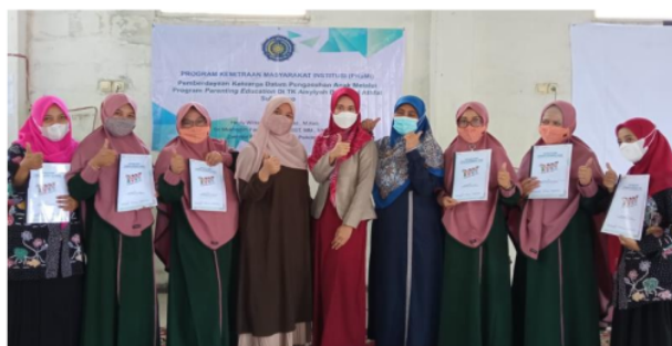
Gambar 4. Tim pengabdian dan guru TK Aisyiyah setelah kegiatan pelatihan

Tindak lanjut yang akan dilakukan setelah pelatihan ini yaitu dengan mengaplikasikannya kepada anak didik yang akan didampingi oleh tim pengabdian dan akan dilakukan rutin setiap 6 bulan untuk mengevaluasi dan memantau perkembangan anak.