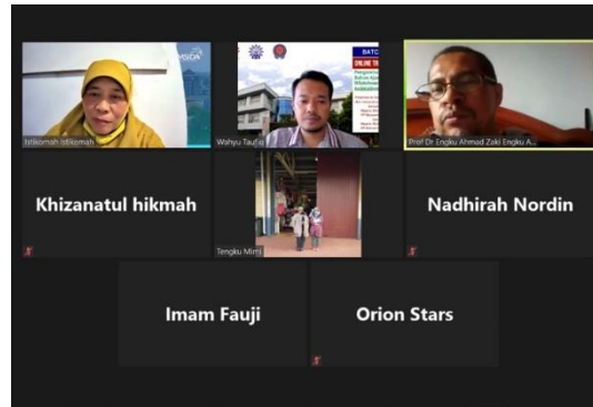
Gambar 3. Pendampingan melalui zoom

Proses pendampingan berjalan cukup lama, yaitu sejak bulan November 2020 hingga pertengahan Januari 2021. Hal ini dikarenakan kesibukan para guru untuk mengajar. Dalam menyusun modul itu sendiri, para guru menyusun dengan cara mencicil sesuai jadwal pengajaran yang dilakukan setiap minggunya. Dalam kegiatan, modul yang lebih difokuskan adalah modul pelajaran Bahasa Inggris. Tim pengabdian dan para guru tersebut selanjutnya mendokumentasikan materi yang sudah disusun tersebut dalam sebuah modul yang bisa dijadikan pegangan, untuk bisa dipergunakan baik selama pandemi maupun jika sudah berakhir dan kembali ke kelas normal (Gambar 4).