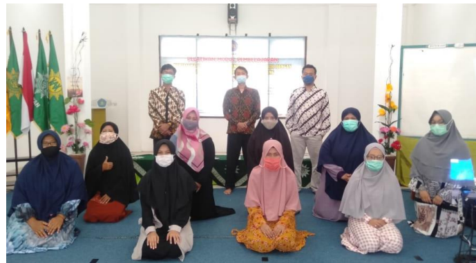
Gambar 1 . Dokumentasi setelah pelaksanaan pelatihan

Pelaksanaan pelatihan dilaksanakan pada tanggal 11 November 2020 bertempat di SMP ABSM ( Gambar 1 ). Kegiatan pelatihan diikuti oleh semua guru. Hal ini dilakukan dengan pertimbangan agar semua guru bisa menerima materi pengembangan modul yang bisa diterapkan selama masa pandemi maupun setelah berakhir. Sedangkan pengembangan modul sendiri akan di khususkan kepada pembelajaran Bahasa Inggris kelas VIII yang sejak awal sudah disesuaikan dengan kepakaran yang dimiliki oleh para pengabdian dan tujuan awal dari pengabdian ini yaitu penyusunan modul untuk pembelajaran Bahasa Inggris. Meskipun demikian, pengajar yang lain juga tetap mengembangkan modul dengan disesuaikan kebutuhan masing-masing.