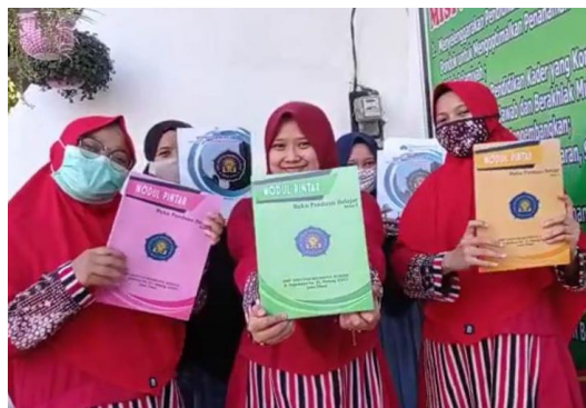
Gambar 4. Modul pembelajaran sebagai hasil pelatihan

Proses pendampingan berjalan cukup lama, yaitu sejak bulan November 2020 hingga pertengahan Januari 2021. Hal ini dikarenakan kesibukan para guru untuk mengajar. Dalam menyusun modul itu sendiri, para guru menyusun dengan cara mencicil sesuai jadwal pengajaran yang dilakukan setiap minggunya. Dalam kegiatan, modul yang lebih difokuskan adalah modul pelajaran Bahasa Inggris. Tim pengabdian dan para guru tersebut selanjutnya mendokumentasikan materi yang sudah disusun tersebut dalam sebuah modul yang bisa dijadikan pegangan, untuk bisa dipergunakan baik selama pandemi maupun jika sudah berakhir dan kembali ke kelas normal (Gambar 4).