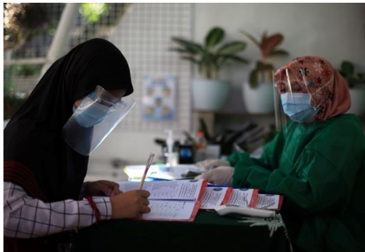
Gambar 2. Pendampingan secara luring

diadakan di sekolah. Tim dan mitra saling memberikan masukan terkait modul yang disajikan.