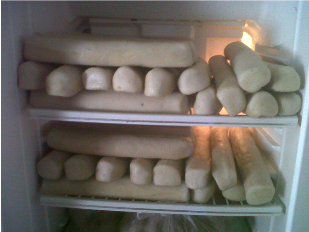
Figure 4. Hasil adonan sebelum dipotong

krupuk dilakukan secara manual, rasa yang dihasilkan setiap adonan tidak sama, peralatan yang dipergunakan tidak memadai. Akan tetapi mitra 2 sudah memiliki alat pemotong krupuk sehingga bentuk krupuk yang dihasilkan sudah bagus dan ketika krupuk dikemas dalam plastik tidak pecah-pecah Figures 4–6 . Namun, ketika sudah dikemas dalam plastik krupuk mudah ayem. Mitra juga belum memahami manajemen keuangan dan produksi, dan sama dengan mitra 1 perizinan juga hanya P-IRT.