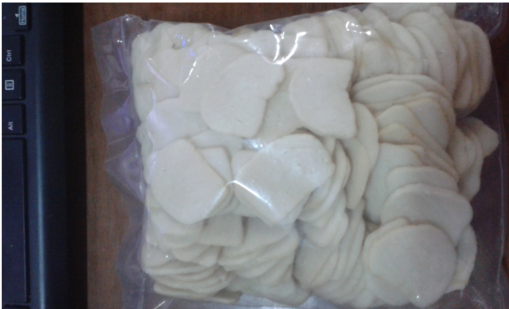
Figure 3. Krupuk yang sudah dikemas oleh mitra (tampak depan)

2. Mitra 2 Hj. Latifatul Usriyah tidak jauh berbeda dengan mitra 1, hanya memproduksi krupuk ikan 7 kg setiap hari sehingga seringkali menolak pesanan. Pengolahan juga dilakukan dengan cara sederhana, pembuatan adonan