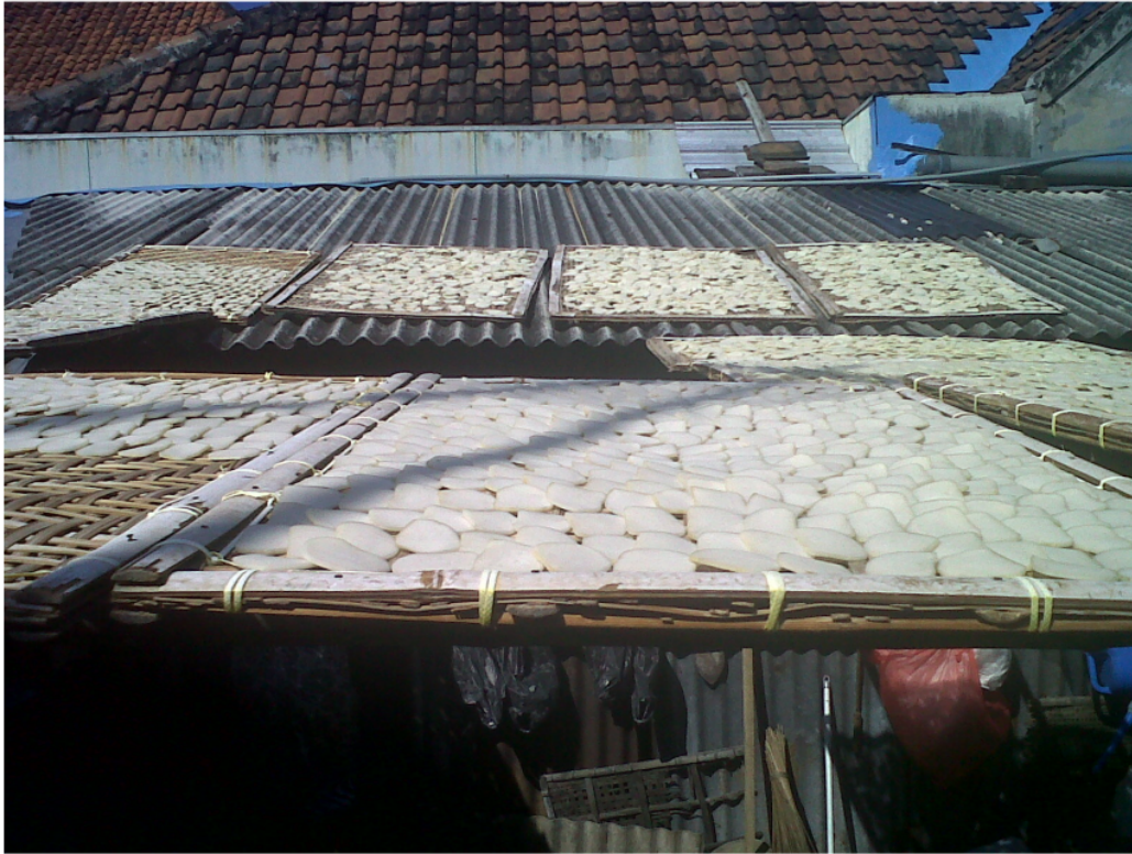
Figure 5. proses penjemuran potongan krupuk oleh mitra 2