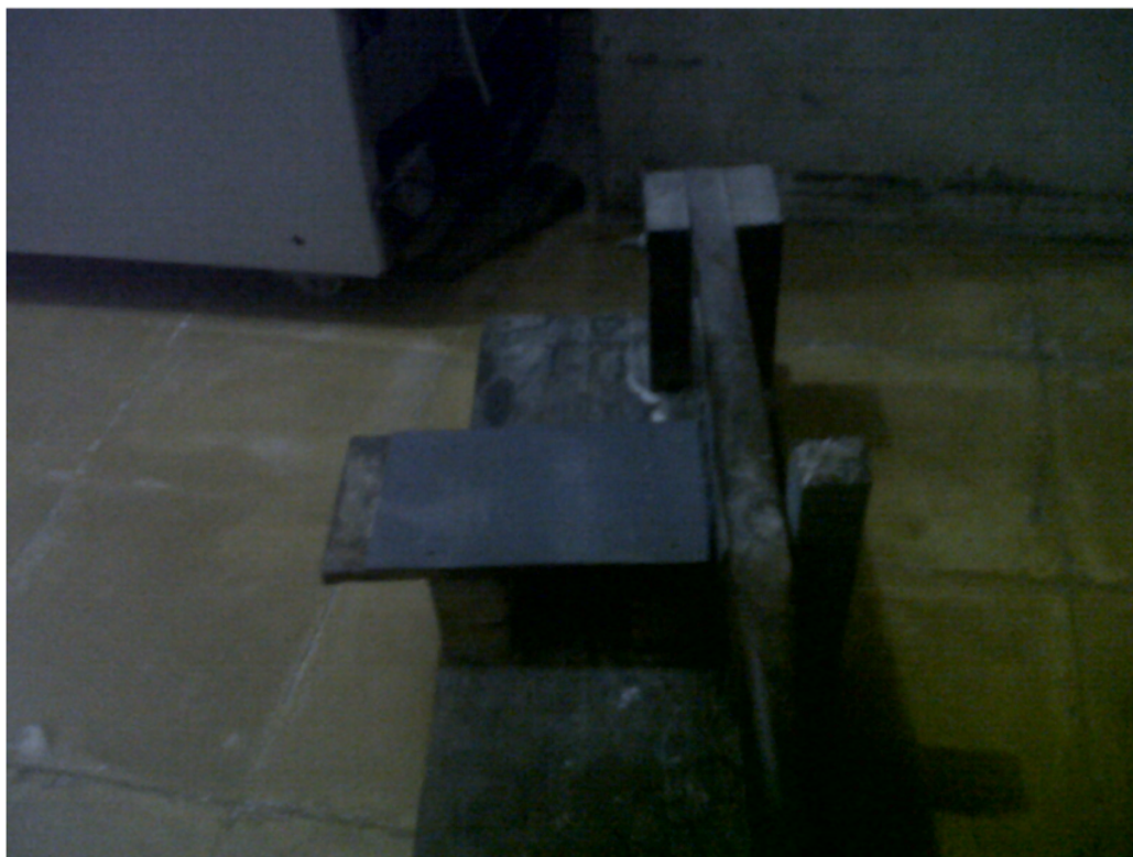
Figure 6. Mesin pemotong krupuk Mitra 2